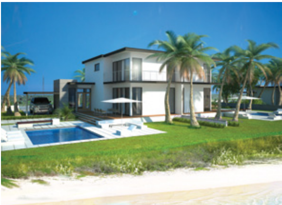
Villa Type C