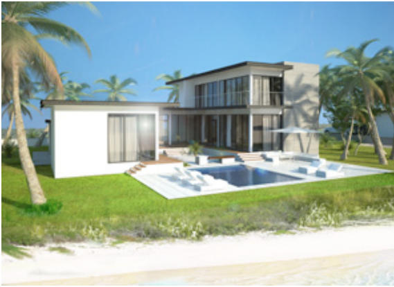
Villa Type B