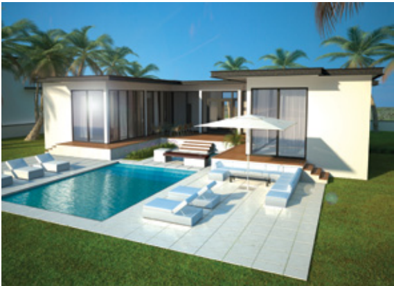
Villa Type A